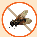
Mosca común (aprox. tamaño real)

Es un insecto díptero con un tamaño pequeño, entre 3-6 mm, mucho menor que la mosca doméstica, es de color negro y tiene las alas blancas.