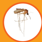
Mosquito (aprox. tamaño real)