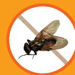
Mosca común (aprox. tamaño real)

Son insectos dípteros, de tamaño pequeño, con una trompa alargada para perforar y chupar. Existen muchas especies con distinto tamaño y color y no todas pican a las personas, las más comunes tienen las alas largas y el cuerpo delgado con patas muy finas.