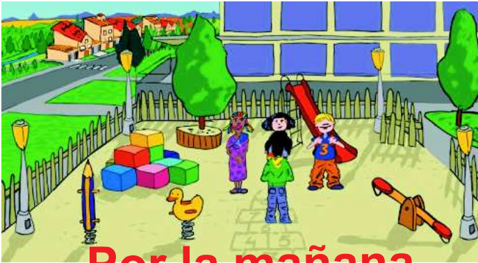
Por la mañana